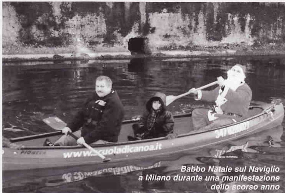
Babbo Natale sul Naviglio a Milano durante una manifestazione dello scorso anno

Qui sotto, anticipiamo i primi mesi del 2003. Dal prossimo numero pubblicheremo l'intero calendario dell'anno a venire. Invitiamo perciò tutti i club ad inviarci al più presto gli appuntamenti programmati ed eventuali aggiornamenti.