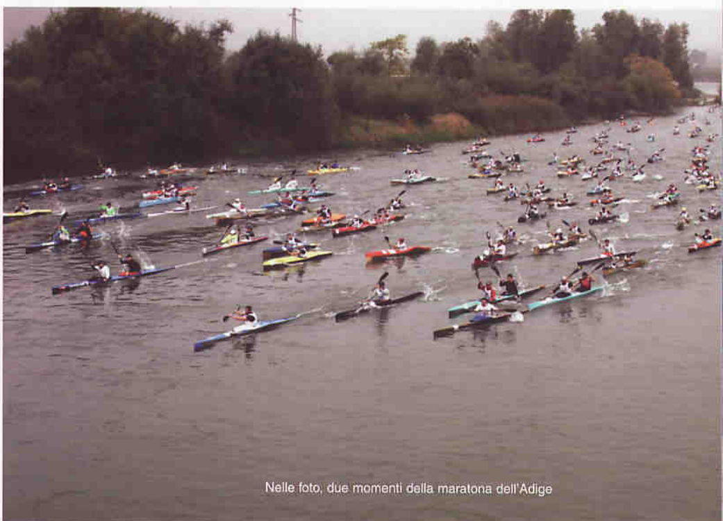
Nelle foto, due momenti della maratona dell'Adige

Cosa succederà in questo nuovo quadriennio? Il nuovo Consiglio FICK deciderà secondo i propri programmi e in piena autonomia. Importanti punti fermi sono che il CSPT è previsto dallo statuto FICK attualmente in vigore, che esistono dei protocolli di intesa firmati dalle varie organizzazioni e che esiste una certa mole di lavoro svolta da tante persone competenti. L'auspicio è che non vada sprecato, non importa chi sarà ad occuparsene.